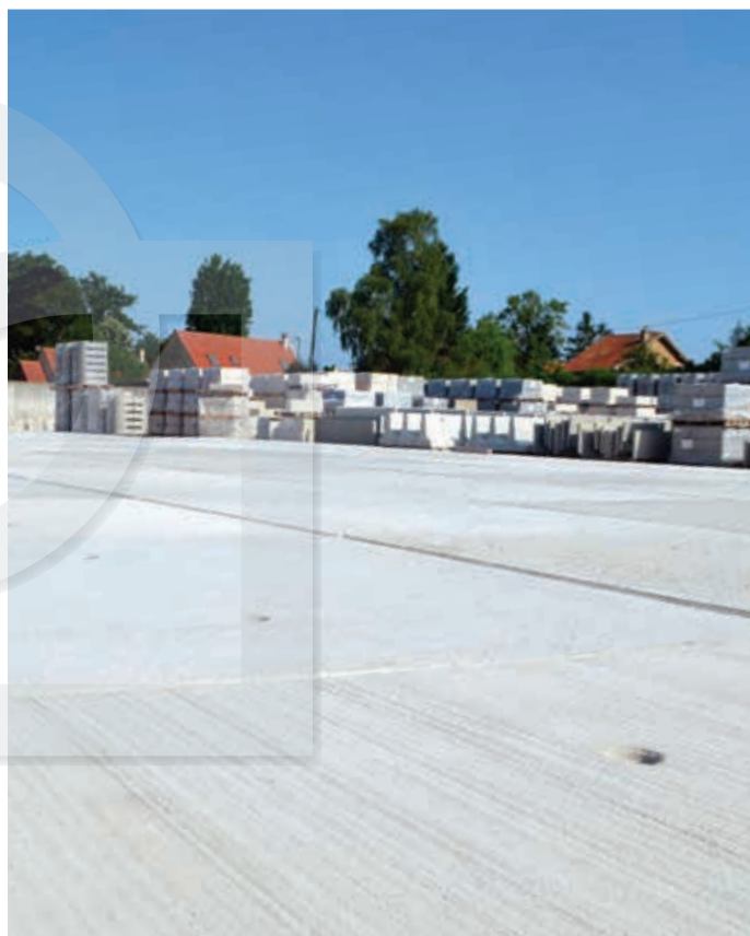
Aspect : béton gris, finition balayé