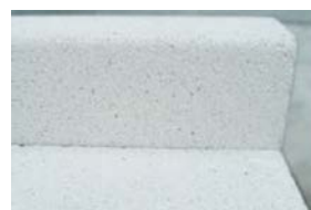
Béton grannit blanc