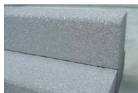
Béton grannit gris