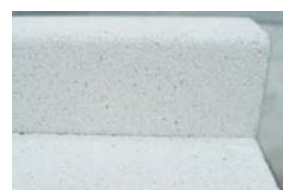
Béton grannit blanc